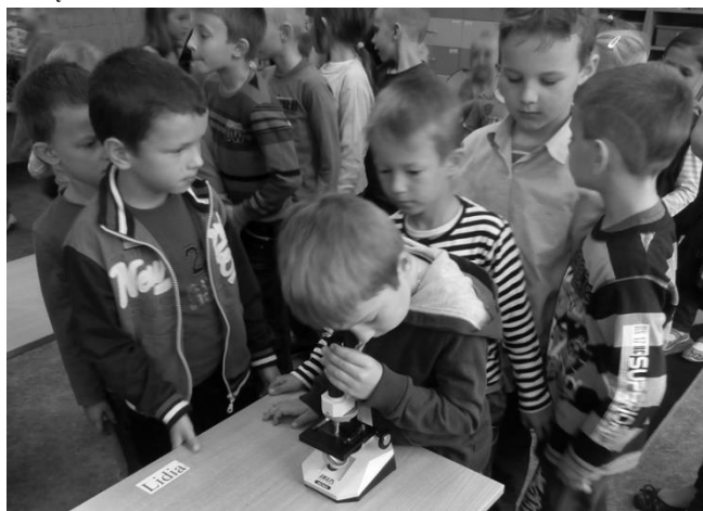
Podczas zajęć lekcyjnych, świetlicowych wszyscy uczniowie naszej

Od października 2015 r. w Zespole Szkół w Marchwaczu realizowana jest kolejna innowacja pedagogiczna pt: „Czysta woda, zdrowe życie”. Innowacja obejmuje dzieci z klas „O”-III. Rodzice naszych uczniów chcąc zadbać o to, aby dziecko miało w szkole dostęp do dobrej jakości wody, wyszli z propozycją, aby udostępnić wodę dla dzieci.